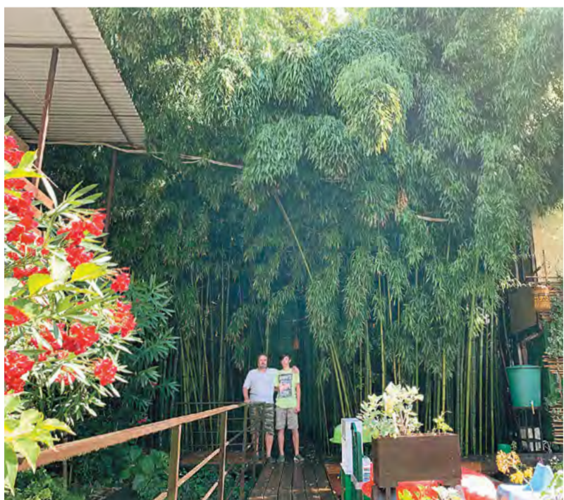
Экоотель «Бамбук Хутор» в Сочи - яркий пример экодевелопмента.

- На рубеже пятидесятилетия, а это достаточно серьезный для человека и философский возрастной рубеж, я задумался о том, что могу сделать в следующей части своей жизни. На