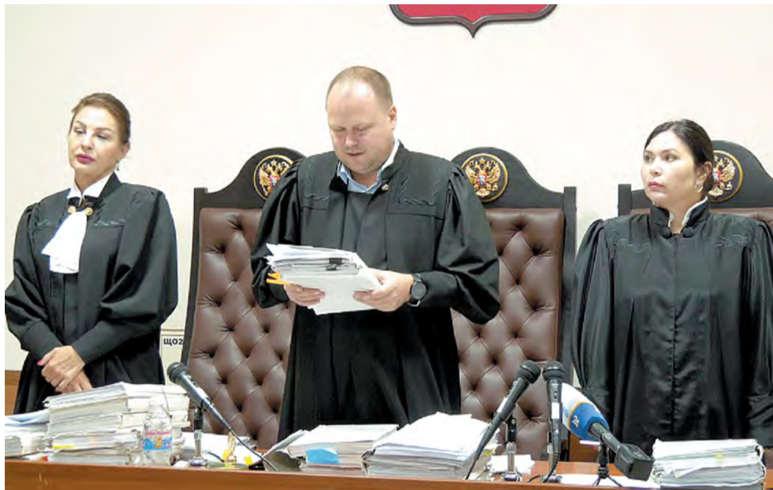
Дело о сносе якобы самостроя продолжает виражи в судебных заседаниях.

Расследование по делу о двух соседствующих строениях на Хостинском рынке кубанские журналисты ведут давно. Но нет ответа на вопрос, почему в столь прозрачном деле до сих пор не поставлена точка. Может, загвоздка в привычном для многих юж-